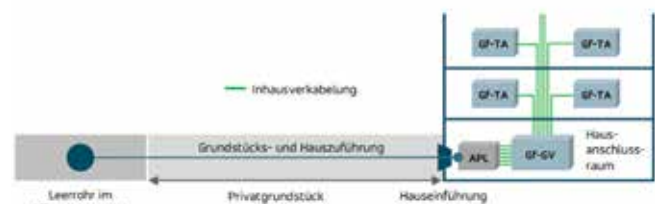
Prinzipische Skizze Mehrfamilienhaus

In Mehrfamilienhäusern endet die Leistung immer mit der Installation und Inbetriebnahme des APL.